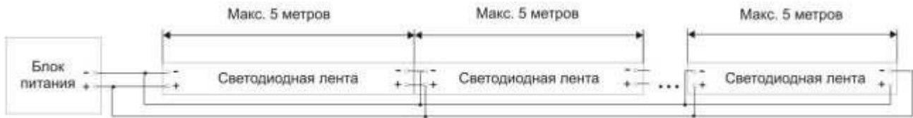
Схема подключения RGB ленты :